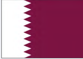
برنامج قطر للمسؤولية المجتمعية

تختار الشبكة الإقليمية للمسؤولية المجتمعية رؤساء برامج لها في الدول العربية، من الشخصيات المهنية المعتبرة وذات التأثير الواسع، ومن مواطني ذات الدولة التي يدرشن فيها البرنامج، ليساهم في دعم جهود الشبكة الإقليمية للمسؤولية المجتمعية في هذه الدولة، ويعمل على الترويج لخدماتها، إضافة إلى دوره في تعزيز العلاقات مع المؤسسات والأفراد في دولته مع الشبكة الإقليمية للمسؤولية الاجتماعية.