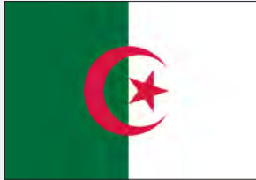
برنامج الجزائر للمسؤولية المجتمعية