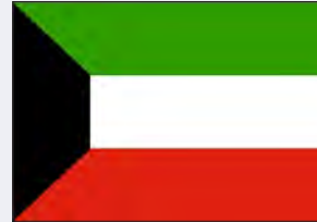
برنامج الكويت للمسؤولية المجتمعية