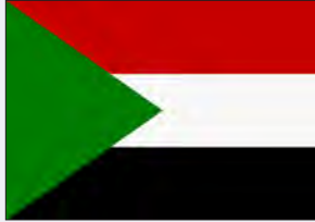
برنامج السودان للمسؤولية المجتمعية