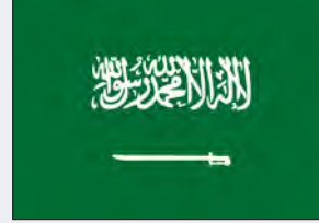
برنامج السعودية للمسؤولية المجتمعية