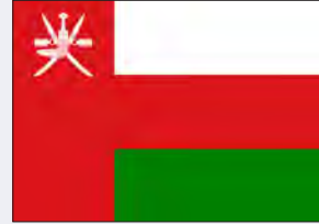
برنامج عمان للمسؤولية المجتمعية