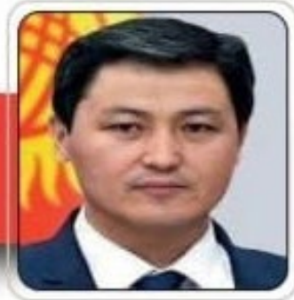
فخامة السيد أولوكيك ماريوف رئيس مجلس وزراء جمهورية قيرغيزيا الراعي الفخري