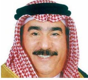
سعادة الدكتور حسن ابراهيم كمال عضو مجلس أمناء المؤسسة الخيرية الملكية السفير الدولي للمسؤولية المجتمعية مملكة البحرين