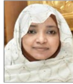
سعادة الدكتورة أمل البكري الييلي وزيرة سابقة وأكاديمية وخبيرة في مجال المسؤولية المجتمعية