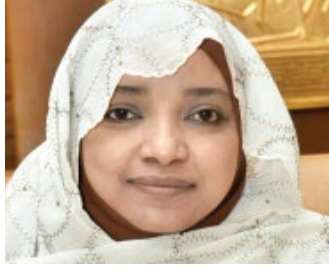
سعادة الدكتورة أمل البكري البيلي السفير الدولي للمسؤولية المجتمعية جمهورية السودان