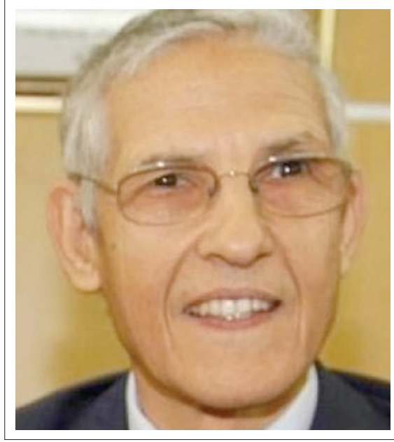
سعادة الوزير لحسن الداودي وزير الشؤون العامة والحكومة المغربي المملكة المغربية نائب ضيف الشرف