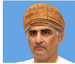
المكرم حاتم بن حمد الطائي عضو مجلس الدولة العضو الشرفي للاتحاد الدولي للمسؤولية المجتمعية سلطنة عمان