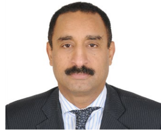
سعادة الدكتور هاشم سليمان حسين رئيس مكتب ترويج الاستثمار والتكنولوجيا في منظمة الأمم المتحدة للتنمية الصناعية «يونيدو» السفير الدولي للمسؤولية المجتمعية مملكة البحرين