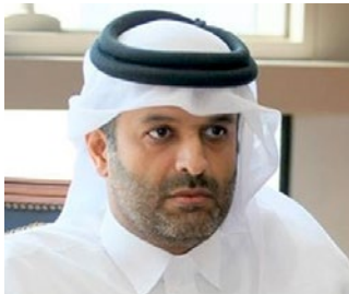
سعادة الشيخ الدكتور ثاني بن علي بن سعود آل ثاني محامي وعضو مجلس إدارة مركز قطر الدولي للتوفيق والتحكيم السفير الدولي للمسؤولية المجتمعية دولة قطر