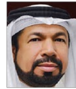
سعادة الدكتور صلاح علي محمد عبدالرحمن وزير وبرلماني سابق