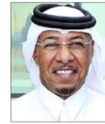
سعادة الدكتور سيف بن علي الحجري مؤسس ورئيس برنامج أصدقاء الطبيعة