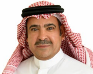
سعادة الدكتور يوسف عثمان الحزيم الأمين العام لمؤسسة العنود الخيرية الرئيس التنفيذي لمؤسسة العنود للاستثمار - المفوض الاممي للترويج لأهداف الأمم المتحدة للتنمية المستدامة المملكة العربية السعودية