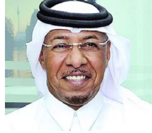
سعادة الدكتور سيف بن علي الحجري السفير الدولي للمسؤولية المجتمعية مؤسس ورئيس برنامج أصدقاء الطبيعة دولة قطر