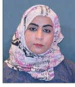
معالي الشبيخة عائشة بنت خلفان السيابية رئيسة الهيئة العامة للصناعات الحرفية