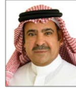
سعادة الدكتور يوسف بن عثمان الحزيم الأمين العام لمؤسسة العنود الخيرية، والرئيس التنفيذي لمؤسسة العنود للاستثمار