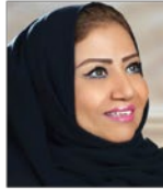
سعادة الدكتورة انتصار أحمد فلمبان رئيسة لجنة المرأة والأسرة بالمنظمة العربية للسلامة المرورية