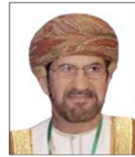
سعادة الشيخ علي بن ناصر المحرقوي أمين عام مجلس الشورى