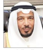
معالي الدكتور عبدالله المعتوق رئيس الهيئة الخيرية الإسلامية العالمية