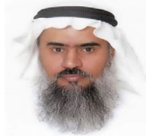
سعادة الدكتور أحمد بن سالم باهمام العضو الفخري للشبكة الإقليمية للمسؤولية الاجتماعية المملكة العربية السعودية