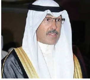
معالي الشيخ فواز الخالد الصباح محافظ محافظة الأحمدية السفير الدولي للمسؤولية المجتمعية دولة الكويت