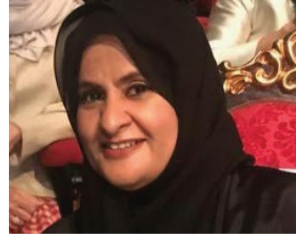
سعادة الشيخة لولوة بنت خليفة بن علي آل خليفة نائب رئيس مجلس إدارة جمعية النور للبر العضو الشرفي للاتحاد الدولي للمسؤولية المجتمعية مملكة البحرين