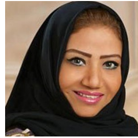
سعادة الدكتورة انتصار أحمد فلميان رئيسة وكالة استجابة لإدارة الأزمات والكوارث. السفير الدولي للمسؤولية المجتمعية المملكة العربية السعودية