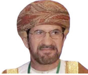
المكرم الشيخ علي بن ناصر المحروقي عضو مجلس الدولة السفير الدولي للمسؤولية المجتمعية سلطنة عمان