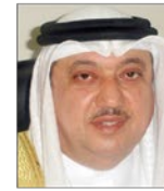
سعادة البروفيسور يوسف عبدالغفار رئيس مجلس إدارة الشبكة الإقليمية للمسؤولية الاجتماعية