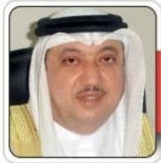
سعادة البروفيسور يوسف عبدالغفار رئيس مجلس إدارة الشبكة الإقليمية للمسؤولية الاجتماعية الرئيس الشرقي