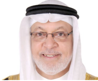
معالي الشيخ دعيج بن خليفة آل خليفة الرئيس الفخري للجمعية الخليجية للإعاقة السفير الدولي للمسؤولية المجتمعية مملكة البحرين