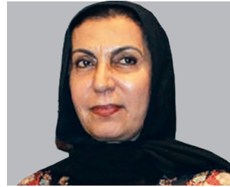
سعادة الشیخة مرايم الخير سفيرة السلام - الرئيس المؤسس لفريق «مرايم الخير» التطوعي الخيري دولة الكويت