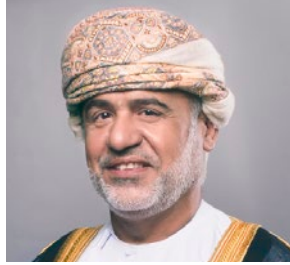
سعادة الدكتور حامد بن عبدالله البلوشي عضو مجلس إدارة مؤسسة جسور عضو الهيئة الإستشارية للاتحاد الدولي للمسؤولية المجتمعية سلطنة عمان