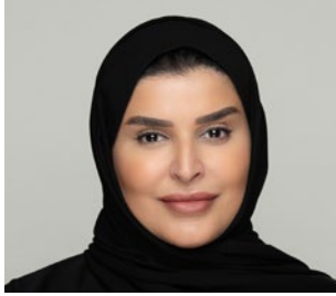
سعادة الأستاذة مريم بنت علي بن ناصر المسند وزيرة التنمية الاجتماعية والأسرة دولة قطر