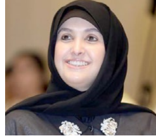
سعادة الشيخة سهيلة سالم الصباح السفير الدولي للمسؤولية المجتمعية دولة الكويت