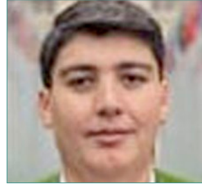
سعادة السيد عبد الله الطائي مبعوث دولي خاص لشؤون الدبلوماسية الإنسانية منسق الدبلوماسية الإنسانية مؤسسة الإغاثة الإنسانية IHH الجمهورية التركية