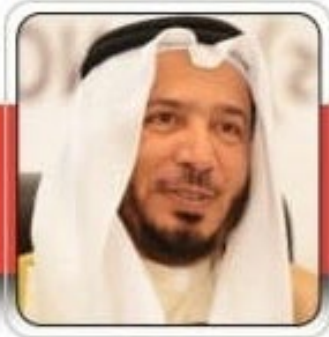
معالي الدكتور عبدالله معتوق المعتوق رئيس الهيئة الخيرية الإسلامية العالمية العضو الشريفة للاتحاد الدولي للمسؤولية المجتمعية صيف الشرف