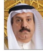
سعادة الأستاذ عدنان أحمد يوسف الرئيس التنفيذي لمجموعة البركة المصرفية