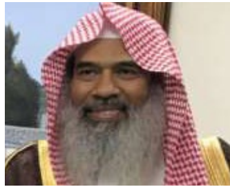
سعادة الشيخ أحمد الصبان مستشار/ وكيل وزارة الشؤون الإسلامية والأوقاف والدعوة والإرشاد للتخطيط والتطوير سابقاً المملكة العربية السعودية