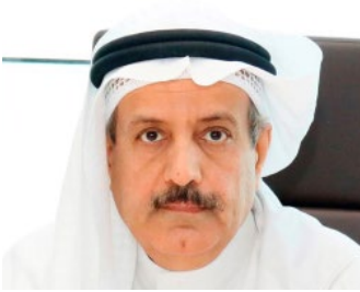
سعادة الأستاذ عدنان أحمد يوسف خبير اقتصادي رئيس مجلس إدارة جمعية مصارف البحرين السفير الدولي للمسؤولية المجتمعية مملكة البحرين