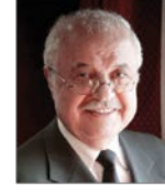
سعادة الدكتور طلال أبوغزاله رئيس مجلس إدارة مجموعة طلال أبوغزاله