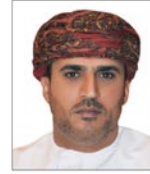
سعادة الشيخ عبدالله بن سالم الرواس رئيس المؤسسة الدولية للتنمية المستدامة