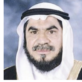
فضيلة الشيخ الدكتور مساعد محمد مندني السفير الدولي للمسؤولية المجتمعية رئيس مجلس إدارة جمعية التكافل الاجتماعي لرعاية السجناء المعسرین دولة الكويت