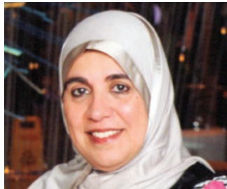
معالي الشخبة لمياء بنت محمد آل خليفة رئيسة مجلس إدارة جمعية النور للبر السفير الدولي للمسؤولية المجتمعية مملكة البحرين