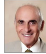
سعادة السيد منيب المصري رئيس مجلس إدارة صندوق ووقفية القدس