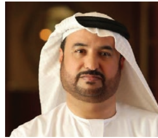
سعادة الأستاذ جمال بن عبيد البح رئيس منظمة الأسرة العربية السفير الدولي للمسؤولية المجتمعية دولة الإمارات العربية المتحدة