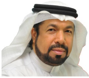
سعادة الدكتور صلاح بن علي محمد عبد الرحمن وزير وبرلماني سابق السفير الدولي للمسؤولية المجتمعية مملكة البحرين