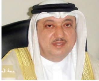
سعادة البروفيسور يوسف عبدالغفار السفير الدولي للمسؤولية المجتمعية رئيس مجلس إدارة الشبكة الإقليمية للمسؤولية الاجتماعية مملكة البحرين