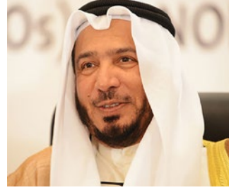
معالي الدكتور عبد الله معتوق المعتوق رئيس الهيئة الخيرية الإسلامية العالمية العضو الشرفي للإتحاد الدولي للمسؤولية المجتمعية دولة الكويت