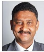
سعادة المهندس طارق حمزة الرئيس التنفيذي لمجموعة سوداتيل