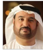
سعادة الأستاذ جمال البح رئيس منظمة الأسرة العربية