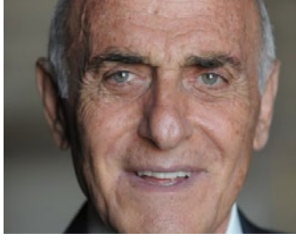
معالي السيد منيب المصري رئيس مجلس إدارة مؤسسة منيب وانجلا المصري السفير الدولي للمسؤولية المجتمعية