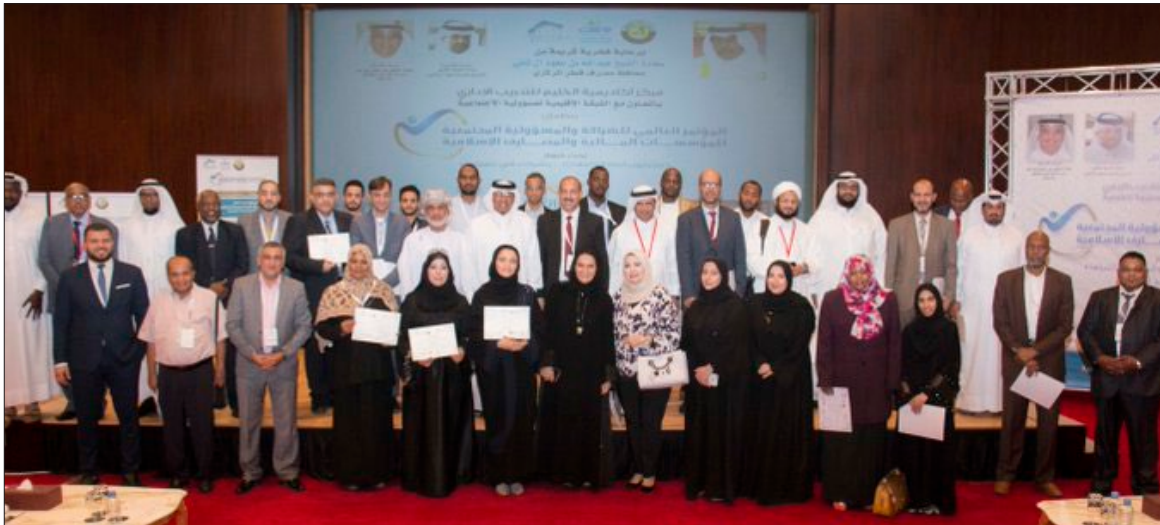
(10) مؤتمر وجائزة المؤسسات المالية والمصارف الإسلامية