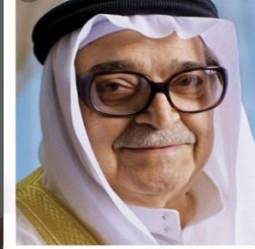
الشيخ صالح بن عبدالله كامل مؤسس مجموعة البركة المصرفية (يرحمه الله)

الدورة الخامسة دورة المغفور له بإذن الله