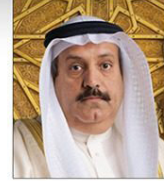
الراعي الفخري للمؤتمر سعادة السيد أعدنان أحمد يوسف

الرئيس التنفيذي لمجموعة البركة المصرفية السكرتير الدولي للمسؤولية المجتمعية