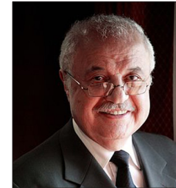
سعادة الدكتور طلال أبوغزالة مؤسس ورئيس مجموعة طلال أبوغزالة الدولية المملكة الأردنية الهاشمية الدورة الرابعة