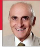
معالي السيد منيب المصري رئيس مؤسسة منيب المصري للتنمية عضو مؤسس لبنك الإسلامي القطري والبنك الوطني في فلسطين