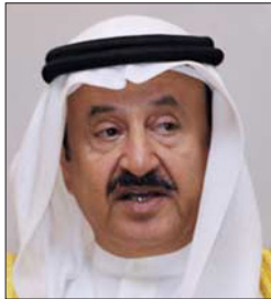
معالي الشيخ إبراهيم بن خليفة آل خليفة رئيس مجلس أمناء هيئة المحاسبة والمراجعة للمؤسسات المالية الإسلامية (أبيجي) مملكة البحرين الدورة السادسة