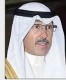
معالي الشيخ فواز بن خالد الصباح محافظ محافظة الأحمدي بدولة الكويت