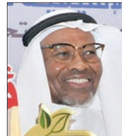
معالي الدكتور أحمد محمد علي الرئيس المؤسس للبنك الإسلامي للتنمية المملكة العربية السعودية الدورة الأولى