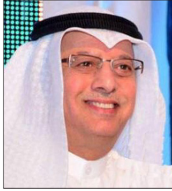
سعادة الدكتور بدر عثمان مال الله مدير عام المعهد العربي للتخطيط دولة الكويت الدورة الثالثة