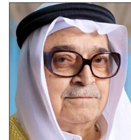
سعادة الشيخ صالح عبدالله كامل مؤسس مجموعة البركة المصرفية المملكة العربية السعودية الدورة الأولى