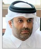
سعادة الشيخ الدكتور ثاني بن علي بن سعود آل ثاني عضو مجلس إدارة مركز قطر الدولي للتوفيق والتحكيم - دولة قطر

المدير العام للمعهد العربي للتخطيط بدولة الكويت السكرتير الدولي للمسؤولية المجتمعية